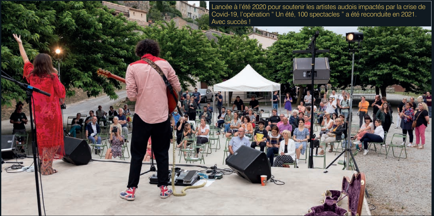
Lancée à l'été 2020 pour soutenir les artistes audois impactés par la crise de Covid-19, l'opération " Un été, 100 spectacles " a été reconduite en 2021. Avec succès !