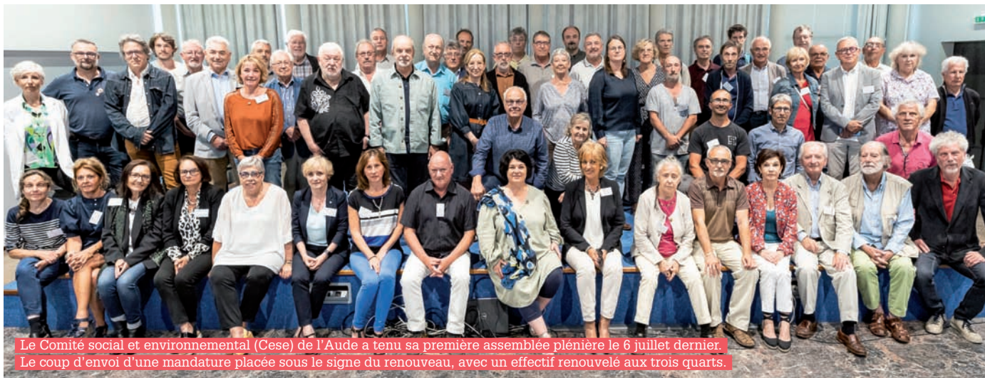
Le Comité social et environnemental (Cese) de l'Aude a tenu sa première assemblée plénière le 6 juillet dernier. Le coup d'envoi d'une mandature placée sous le signe du renouveau, avec un effectif renouvelé aux trois quarts.

85 ORGANISATIONS REPRÉSENTATIVES siègent au Comité social, économique et environnemental (Cese) de l'Aude.