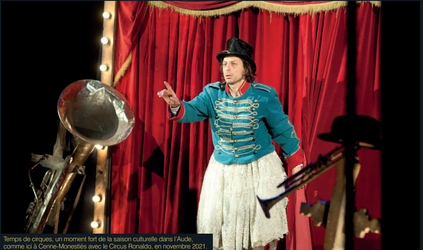
Temps de cirques, un moment fort de la saison culturelle dans l'Aude, comme ici à Cenne-Monestiés avec le Circus Ronaldo, en novembre 2021.