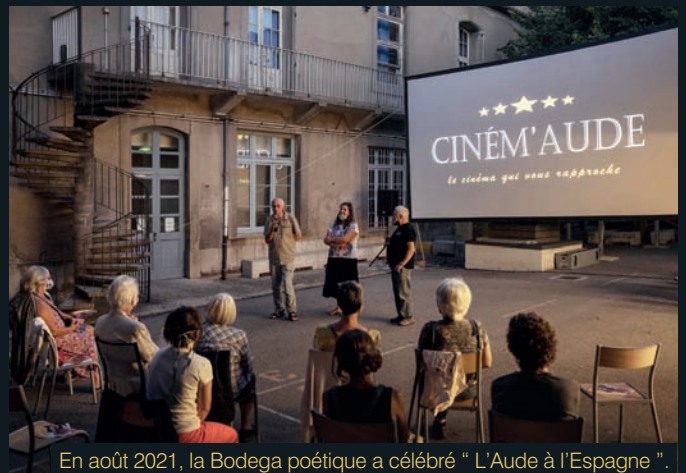
En août 2021, la Bodega poétique a célébré " L'Aude à l'Espagne ".