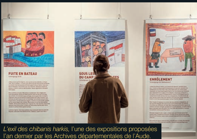
L'exil des chibanis harkis , l'une des expositions proposées l'an dernier par les Archives départementales de l'Aude.