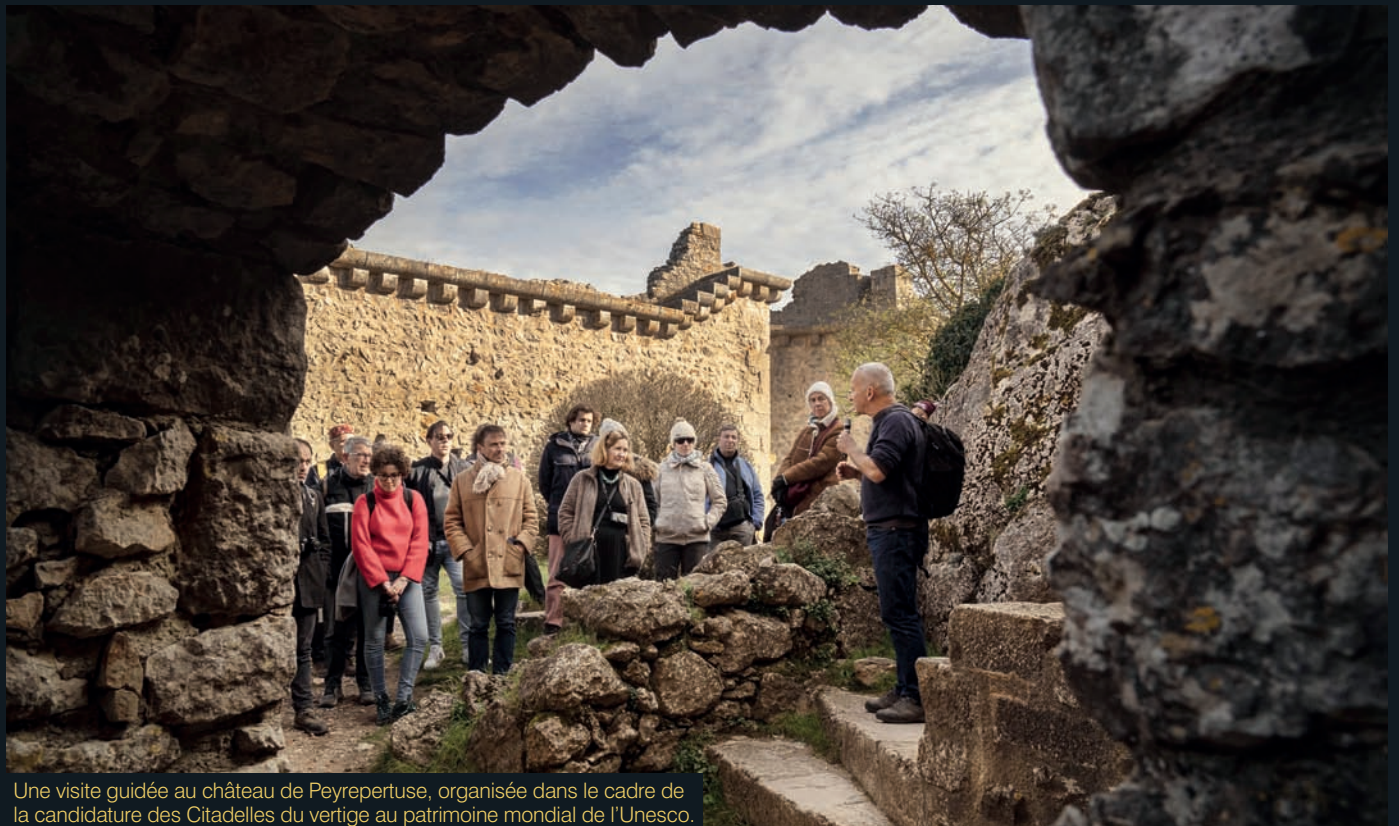
Une visite guidée au château de Peyreperouse, organisée dans le cadre de la candidature des Citadelles du vertige au patrimoine mondial de l'Unesco.