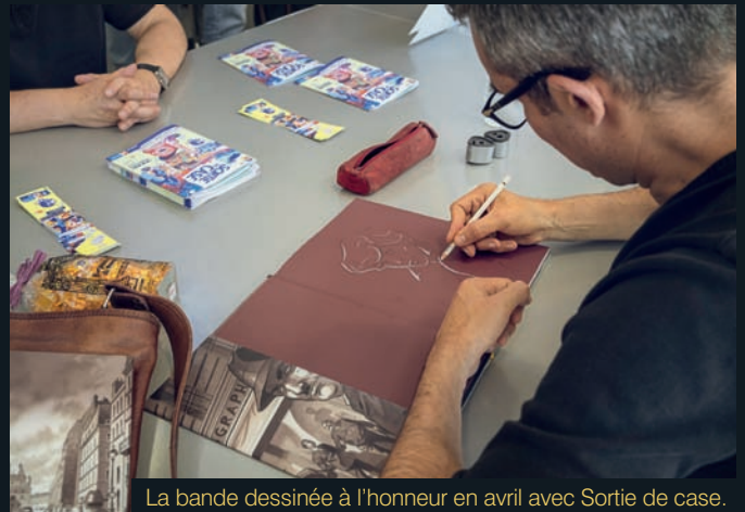
La bande dessinée à l'honneur en avril avec Sortie de case.