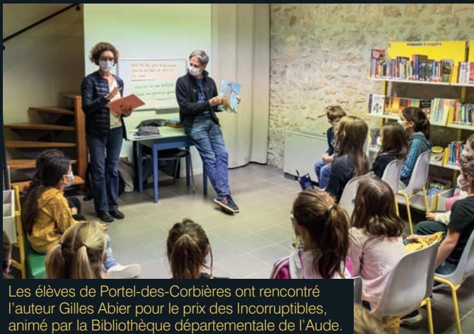
Les élèves de Portel-des-Corbières ont rencontré l'auteur Gilles Abier pour le prix des Incorruptibles, animé par la Bibliothèque départementale de l'Aude.